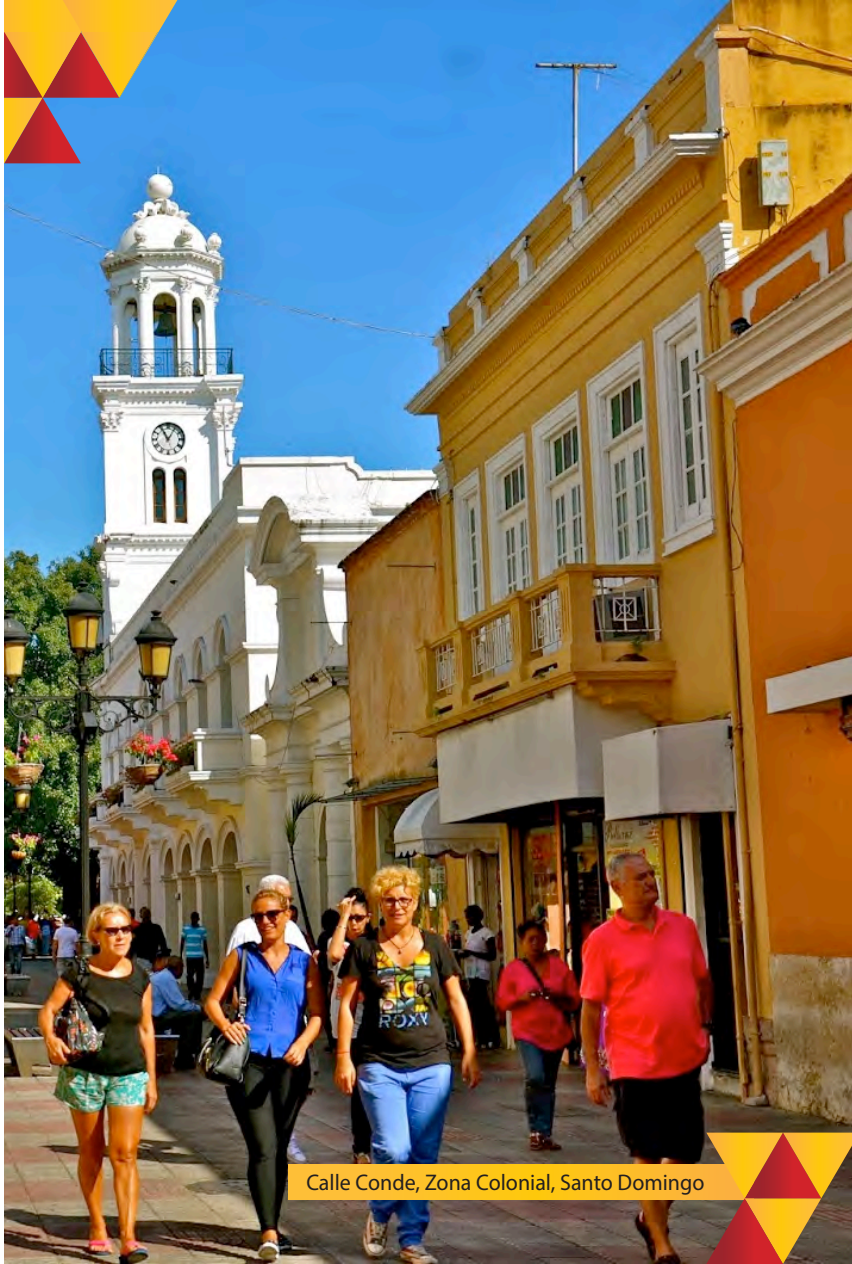
Calle Conde, Zona Colonial, Santo Domingo